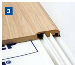
Als Endprofil , z. B. an einer Wand oder einem Fenster.