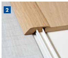
Als Anpassungsprofil zur Verbindung eines Quick-Step® Bodens mit einem anderen, niedrigeren Bodenbelag.