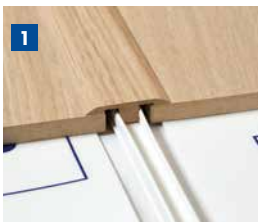
Als Dehnungsprofil zur Verbindung von 2 Böden gleicher Höhe.