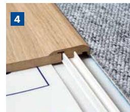
Als Übergang zu einem Teppich.