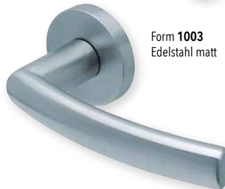
Form 1003 Edelstahl matt