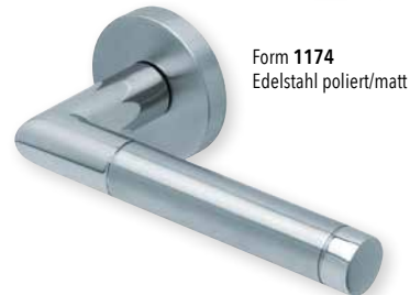
Form 1174 Edelstahl poliert/matt