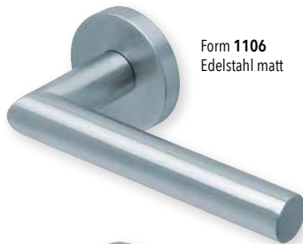
Form 1106 Edelstahl matt

FUNKTIONS- GARANTIE 10 JAHRE TECHNIK MADE IN GERMANY