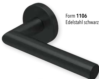
Form 1106 Edelstahl schwarz matt