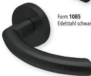
Form 1085 Edelstahl schwarz matt