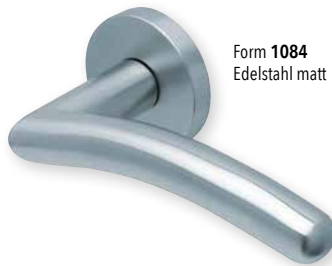
Form 1084 Edelstahl matt