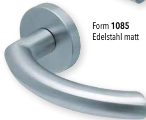
Form 1085 Edelstahl matt