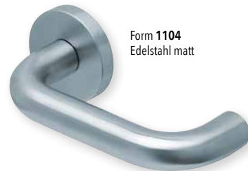
Form 1104 Edelstahl matt