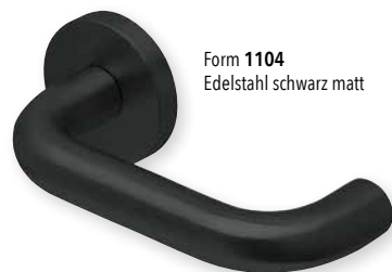
Form 1104 Edelstahl schwarz matt