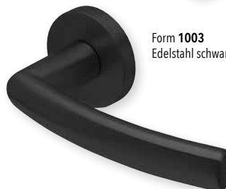
Form 1003 Edelstahl schwarz matt