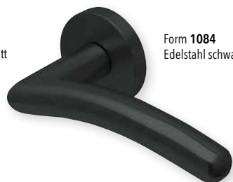
Form 1084 Edelstahl schwarz matt